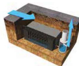
Magazynowanie w celu ponownego użycia