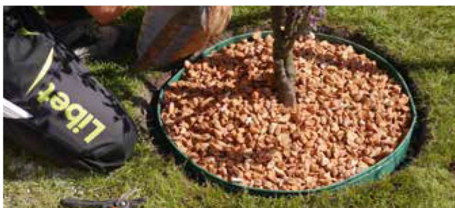
● Łatwy i skuteczny montaż