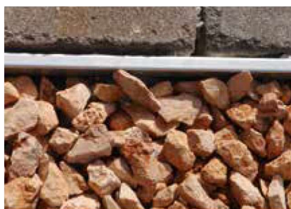
● Atrakcyjny wygląd