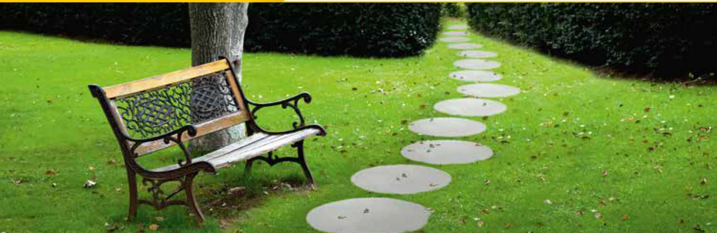
KOŁO TRAWERTYN bianco