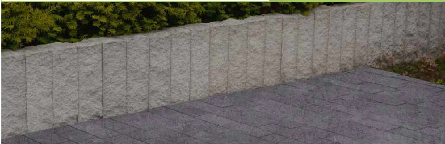
MINI TRIO tytanowy PALISADA SPLIT bianco carrara